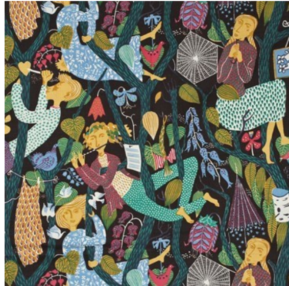
Tyg Melodi 1947 © Stig Lindberg

www.vbm.se/evenemang/vernissage-stig-lindberg