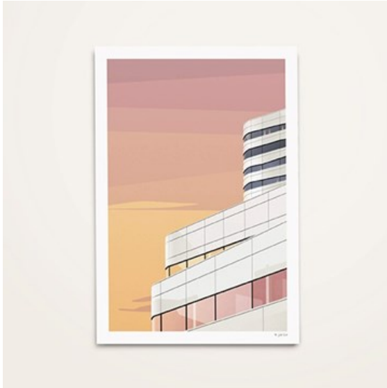
Illustration: Väven av Julie Thiel