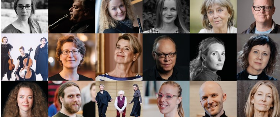
Svenska kyrkan firar Umeå 400 år under nio dagar i maj-juni.