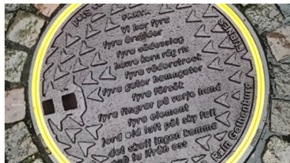
Brunnslocksposi på gång i Umeå!

Umeå fyller 400 år. Tänk att vi dricker samma vatten nu som då. Det är värt att firas, eller hur?